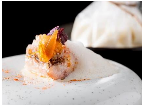
ディナーパーティメニュー “魚”イメージ

前菜 帆立と鮪のタルタル、セロリと山葵のゼリー添え 前菜 ブルターニュ産オマール海老のサラダ 赤い葛、トリュフ風味 魚 甘鯛のソテー 雲丹風味のバターソース 鴨の味噌漬け添え 蕪のブイヨンと共に グラニテ お酒のグラニテキャビア添え 和牛 近江牛の昆布締め 白味噌とジャガイモのムースリース 湯葉 カネロニシェーブ 龍の瞳 鼈オジャ デザート 山椒風味のチョコレートタルトとコーヒーのサバイヨン