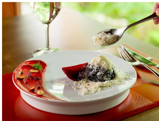
特別ランチ「都華」“鰻”イメージ