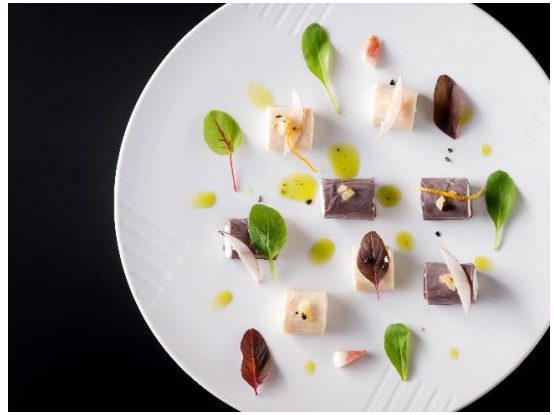
ディナーパーティメニュー “湯葉”イメージ

開催日： 2017年10月27日(金) 開催場所： 日本庭園、レストラン「京 翠嵐」 スケジュール： 17:30～ シャンパン・レセプション 18:00～ スペシャルディナー 20:00 お開き 料金： 28,000円(税金・サービス料別) ドレスコード： セミフォーマル